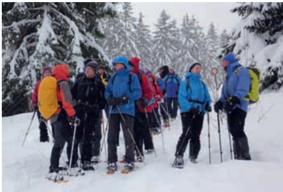
Lundi-X à La Menée, 10.12.12