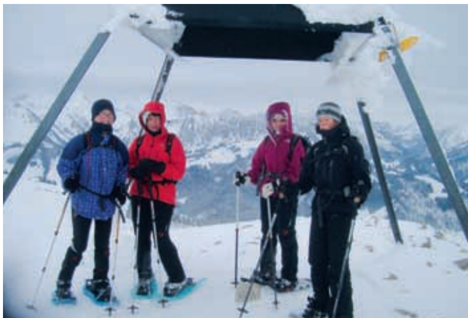
La Berra par le Cousimbert, 13.12.12