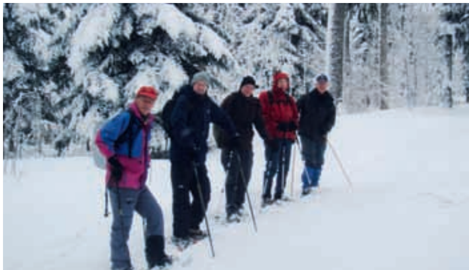
Grand Sommartel, 20.12.12