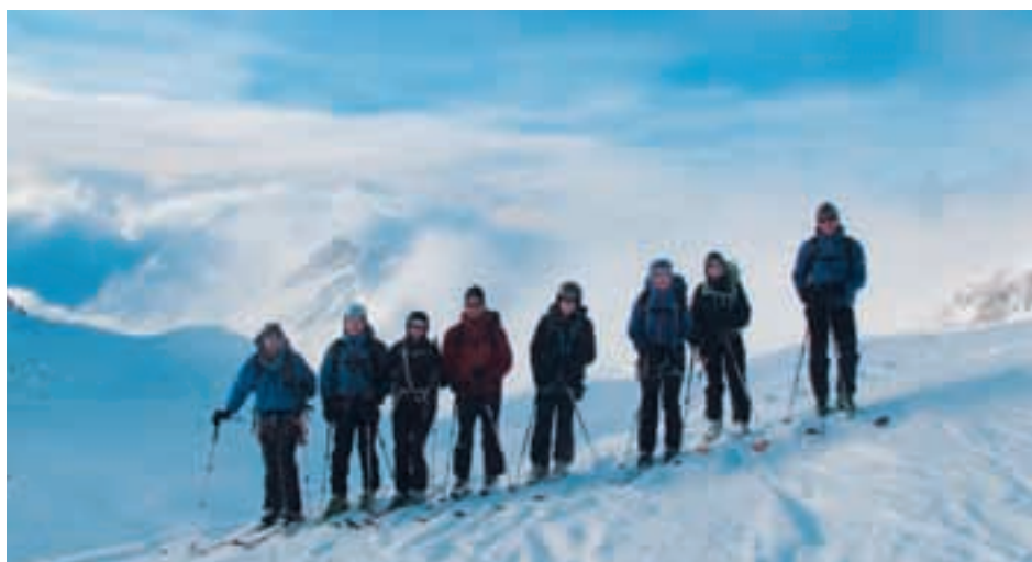
Autour de la cabane Jürg Jenatsch, 3-6.01.13