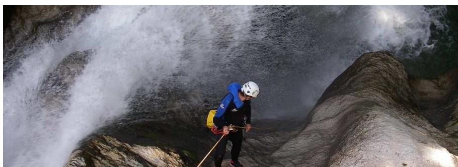
Figure 3 : Première cascade de Coiserette

Certains canyons du massif comptent parmi les plus beaux d'Europe (Coiserette) !