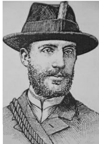
Figure 3 : Edouard Alfred MARTEL (père de la spéléologie)

Petit à petit, des spéléos se sont dit que ce serait plus simple d'explorer « à la descente ». Le canyoning moderne était né !