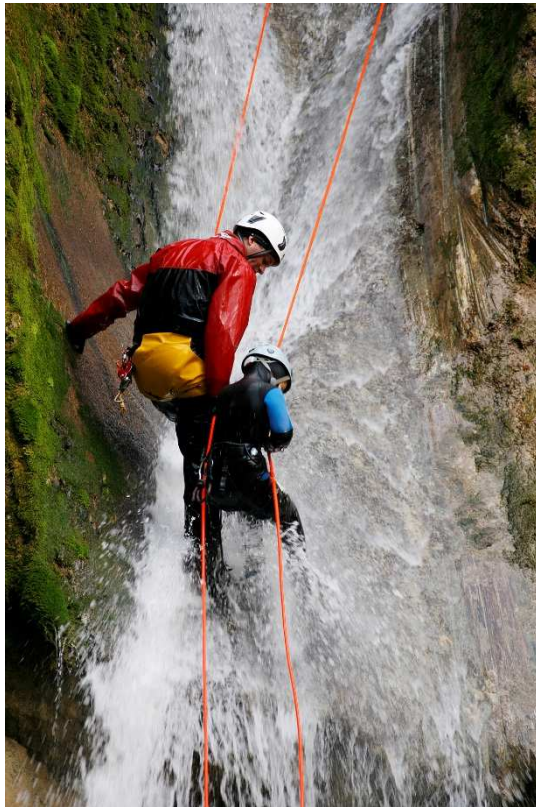
Figure 1 : Descente en rappel, cascade de Vulvoz