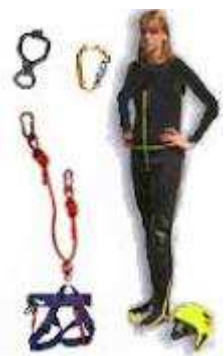
Figure 2: L'équipement individuel de canyoning

L'équipement collectif est essentiellement constitué de cordes, de matériel de progression, de matériel de sécurité et de secours.