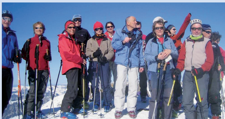
Drümannler, février 2008