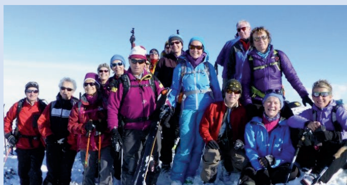
Wirihore, février 2014