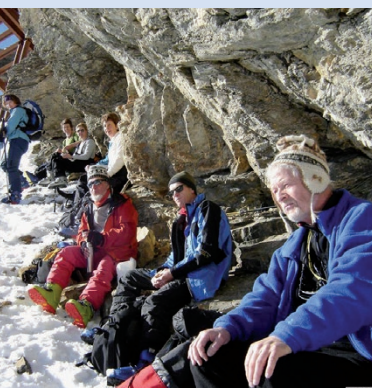
Col du Tarent, janvier 2005