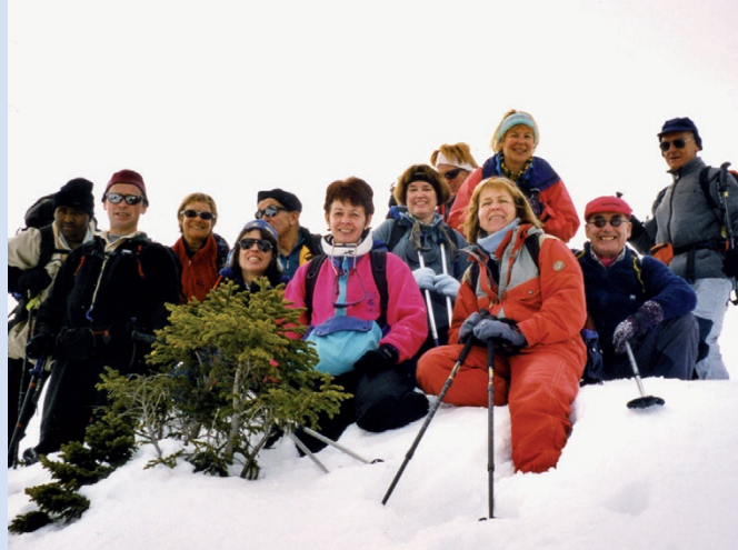
Cape au Moine, février 2003