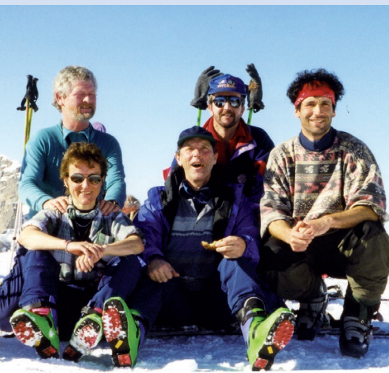
Räuflihorn, février 1998