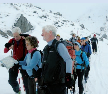
Roter Totz, février 2011