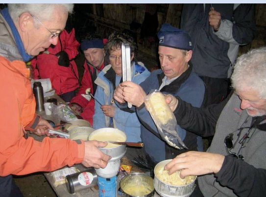
Ankestock, janvier 2007

Vers quelles destinations? La liste ci-dessous n'est pas exhaustive et représente juste un échantillon des sommets atteints. Certains sont des classiques gravés plusieurs fois au cours de ces 20 années mais toujours avec bonheur pour les plus assidus, les conditions n'étant jamais les mêmes. En fonction de la météo, de l'enneigement, du degré d'avalanche, le cap est mis sur le Jura dont le Chasseron et Chasseral, les préalpes et alpes fribourgeoises dont les Millets, le Schafernisch, les Bernoises dont l'Albristhorn, l'Alpigemären, le Wiriehorn, le Burglen le Raufflihorn et le Gsür, les Vaudoises dont la Douve, la Tour de Famelon, le Pic Chaussy et la Para et même le Valais pour les Monts Telliers.