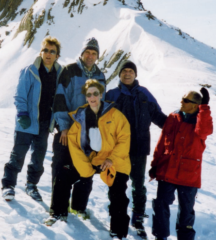
Klein Gsür, février 2002