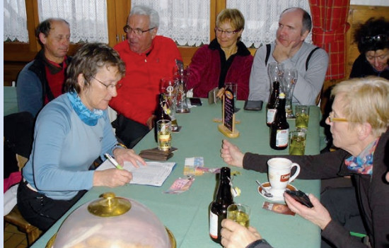
Ättenberg, janvier 2013