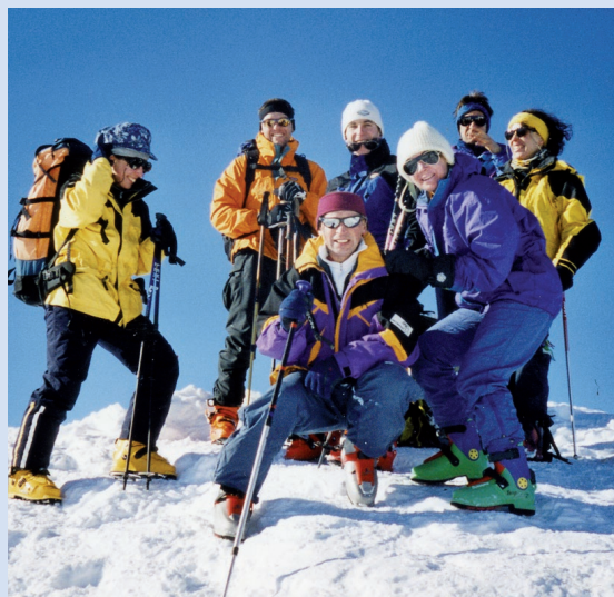
Les Monts Telliers, janvier 2001