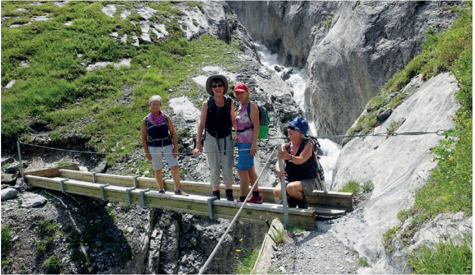
Dames, Balmhorn, 03.07.15