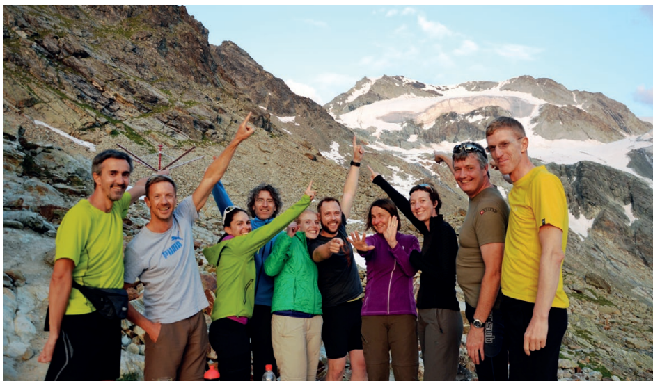
Pigne de La Lé, 04-05.07.15