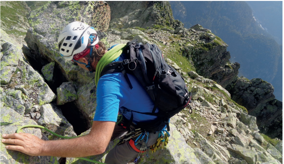
Perfectionnement grimpe alpine, 04.07.15