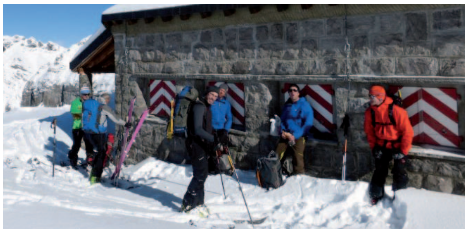
Col du Pacheu, 22.02.14