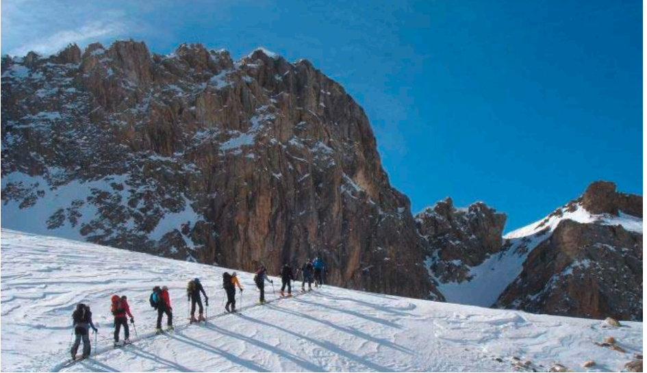
Val Maira, 23.02.14