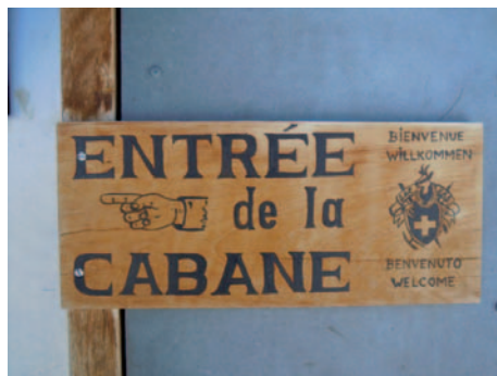
Ouverture de la Cabane Bertol, 11.02.14