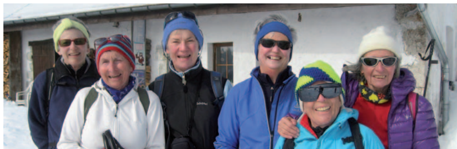
Les dames aux Rochats, 06.03.14

Président de la Section neuchâteloise du CAS